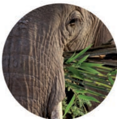
Transport de marchandises