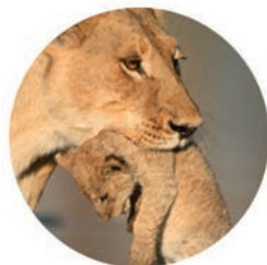
Transport de voyageurs

Vous transportez la vie, nous protégeons la vôtre