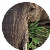
Transport de marchandises