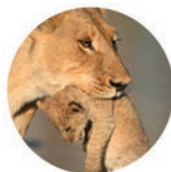
Transport de voyageurs

Vous transportez la vie, nous protégeons la vôtre