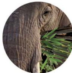
Transport de marchandises