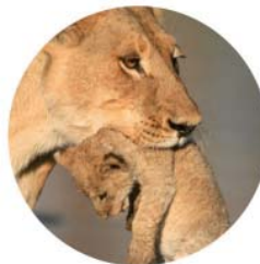
Transport de voyageurs

Vous transportez la vie, nous protégeons la vôtre